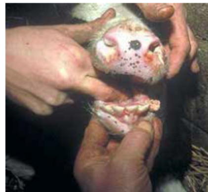
Vær bl.a. opmærksom på sår på mund- og næseslimhinde hos ungdyr.

BVD bekæmpelsen er omfattet af Kvægerstatningsordningen og dækker produktionstab og dyr, der er døde eller aflivede som følge af BVD. Erstatning udbetales dog kun, hvis der ved eventuel eksport benyt-